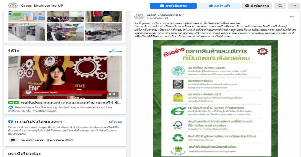
ภาพที่ 1 แสดงสลากสินค้าที่เป็นมิตรกับสิ่งแวดล้อม